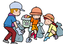
2014年の日海浜清掃活動実施状況