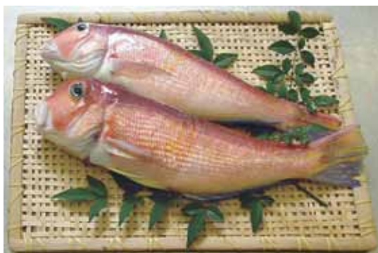
島根県のプライドフィッシュ(夏): アカアマダイ