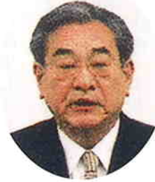
漁業協同組合 JFしまね 代表理事会長